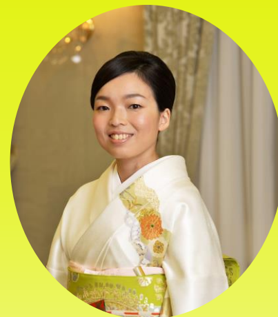
あきこじょうでんか 座長 彬子女王殿下